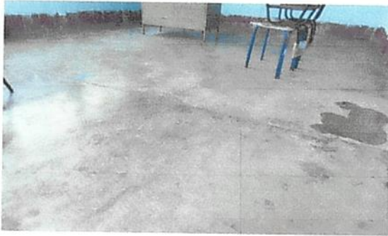
3. sustitucion de piso de torta por piso ceramico.