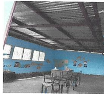
pintura de muro interior y exterior

Observación: Si es necesario se pueden agregar hojas adicionales y actualizar el número de hojas.