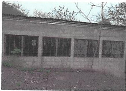
cernido a pared de la parte trasera del aula