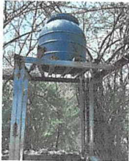
sustitucion de rotoplas y sustitucion de base de metal por metal