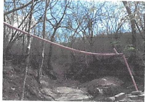
reparacion de drenajes de aguas negras