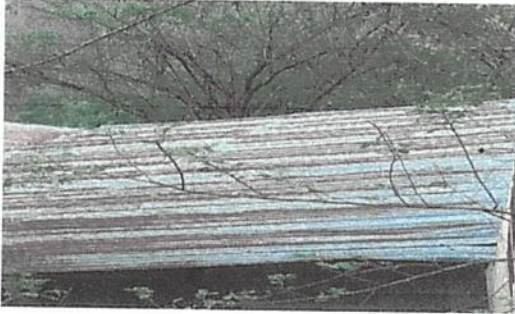
sustitución de lamina normal por lamina troquelada alusin calibre #26.