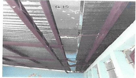
pintura a la estructura del teco