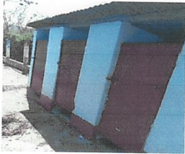
mantenimiento a puertas lijado cepillado y aplicación de pintura, lijado y pintado de estructura de baños