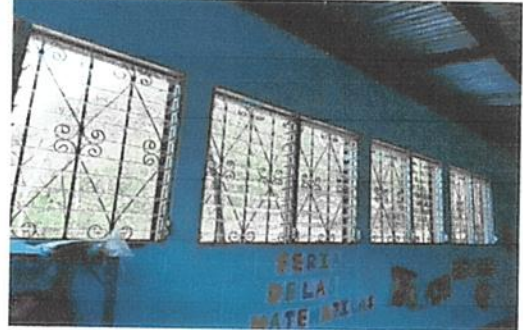
Sumistros e instalacion de ventanas.