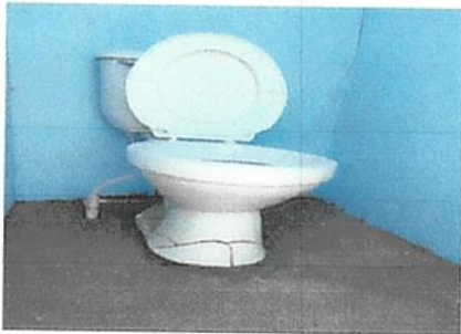
5. sustitución de inodoros.