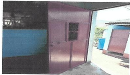
Mantenimiento de puerta.